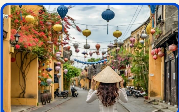
เที่ยวเมืองเก่าฮอยอัน