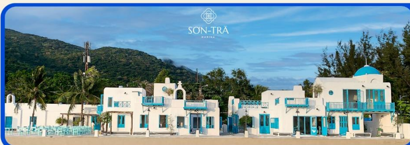
เช็คอินคาเฟ่ SON TRA MARINA