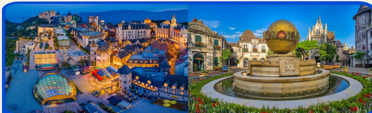
พักผ่อน บานาฮิลล์ 1 คืน